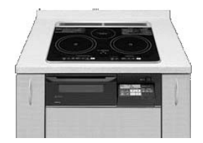
メーカー希望小売価格 ¥246,750