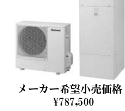
メーカー希望小売価格 ¥787,500