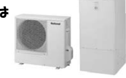
メーカー希望小売価格 ¥714,000