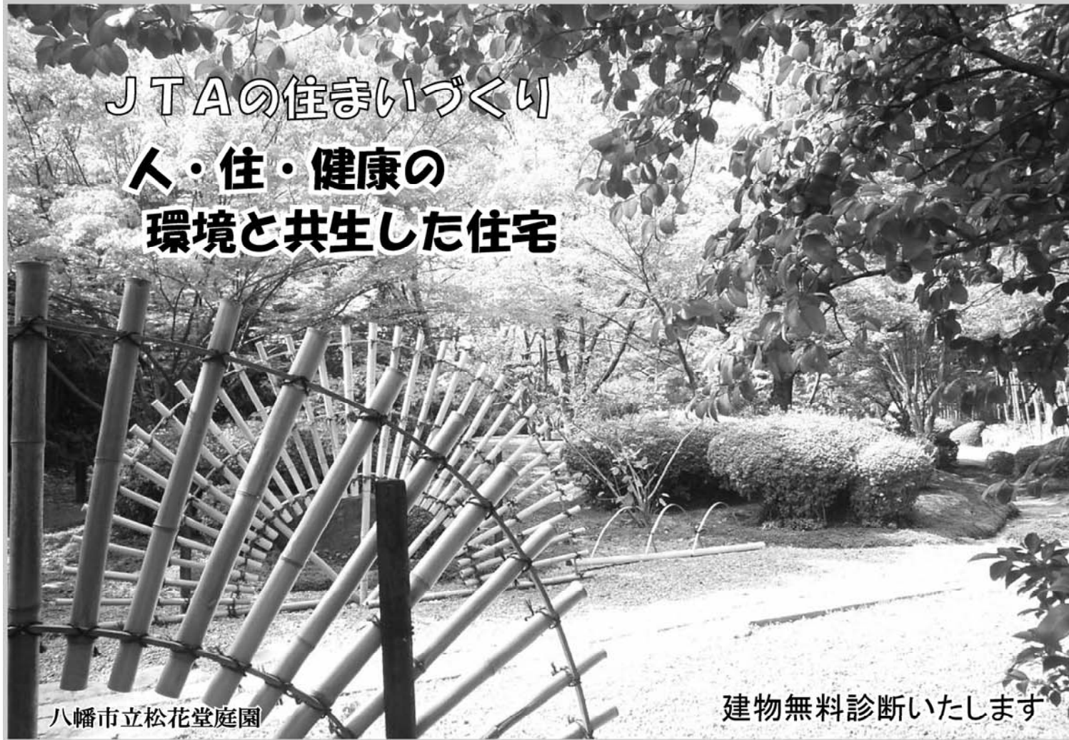
八幡市立松花堂庭園